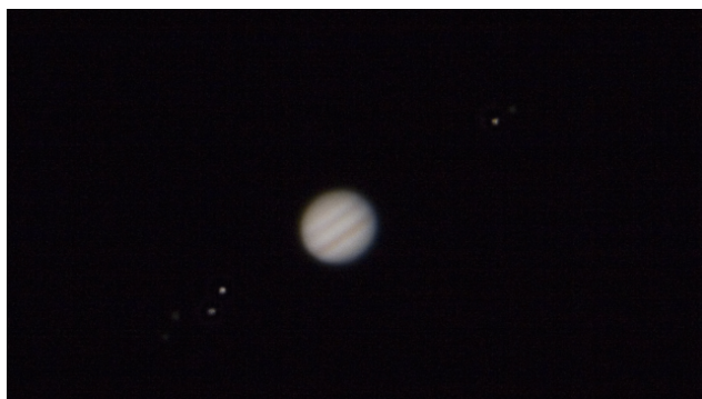
Canon Eos 20D + Celestron 8 v okularni projekciji z okularjem 25 mm. Mode: Tv (čas). Osvetlitev: 1/4 sekunde. Nastavljena občutljivost: ISO 400.

Iztok Bončina , iztok.boncina@guest.arnes.si