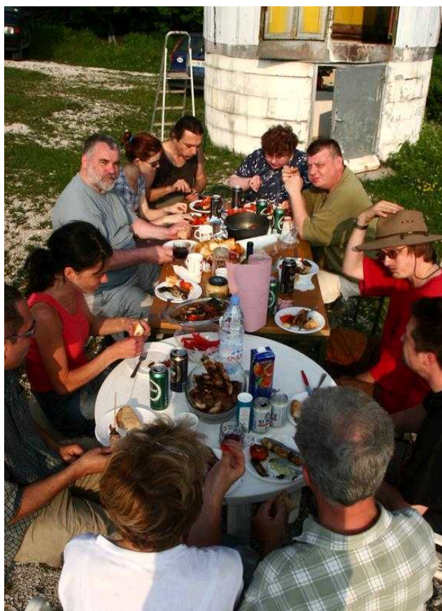
Po delovni akciji se prileže jedača in pijača.